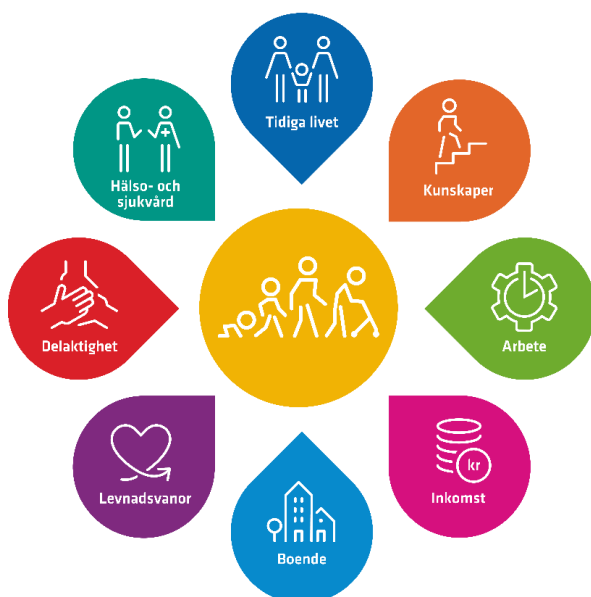
En god och jämlik hälsa – åtta målområden

Det folkhälsopolitiska ramverket delar in förutsättningarna för hälsa i åtta målområden (se figur 1 nedan). De tydliggör att arbetet för en god och jämlik hälsa måste inriktas på de bakomliggande förutsättningarna och de strukturella faktorerna som påverkar hälsa. I linje med dessa målområden och kommunens rådighet fokuserar programmet på fyra områden; barns och ungas uppväxtvillkor; delaktighet, inflytande och tillit; arbete och försörjning; samt boende och livsmiljö.